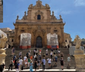
Foto di gruppo dal tour Catania-Siracusa-Ortigia-Noto-Ragusa-Modica-Piazza Armerina.

N on trovate che manchi qualcosa in queste foto? L'arancino, certo, ghiotto protagonista di UCAVInTour.